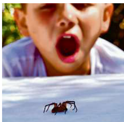
Hilfe, Spinne! Manche Kinder reagieren panisch und ängstlich auf diese Tiere, von denen keine reale Gefahr ausgeht.