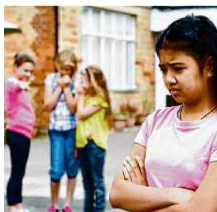
Starke Ängste können sich auch erst im Jugendalter entwickeln, zum Beispiel nach einer Mobbing-Erfahrung.