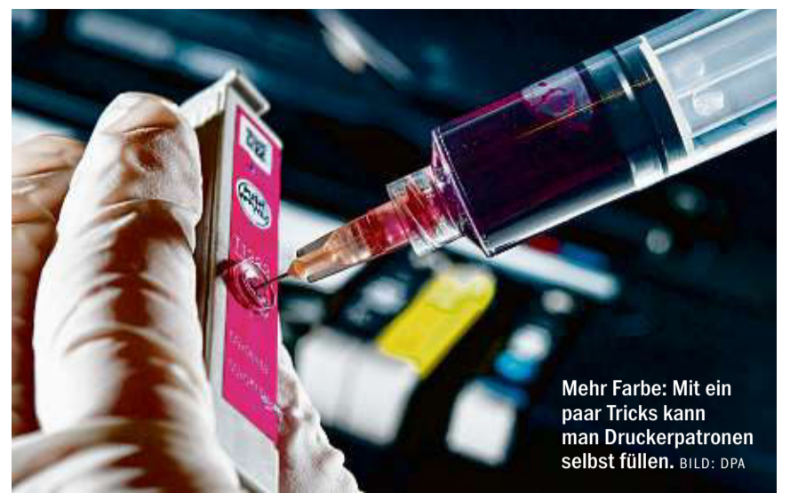
Mehr Farbe: Mit ein paar Tricks kann man Druckerpatronen selbst füllen.

AMDs neue Desktop-Prozessoren Ryzen werden zwischen 360 und 560 Euro kosten. Das geht aus ersten Angeboten im Onlinehandel hervor. Das Einstiegsmodell der neuen Acht-Kern-Chips, der Ryzen 7 1700 mit einer Taktfrequenz von 3 Gigahertz (Ghz), kostet demnach rund 360 Euro. Der stärkere 1700X mit 3,4 Ghz liegt bei etwa 400 Euro, das Spitzenmodell 1800X mit 3,6 Ghz kostet rund 560 Euro. Offizieller Verkaufsstart der Prozessoren soll nach Unternehmensangaben der 2. März sein. (dpa)